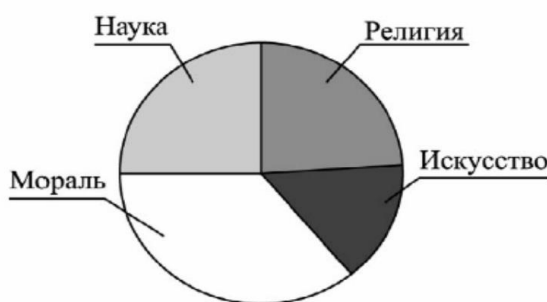
Влияние различных областей культуры на духовный мир личности

Найдите в приведённом списке выводы, которые можно сделать на основе диаграммы, и запишите цифры, под которыми они указаны.